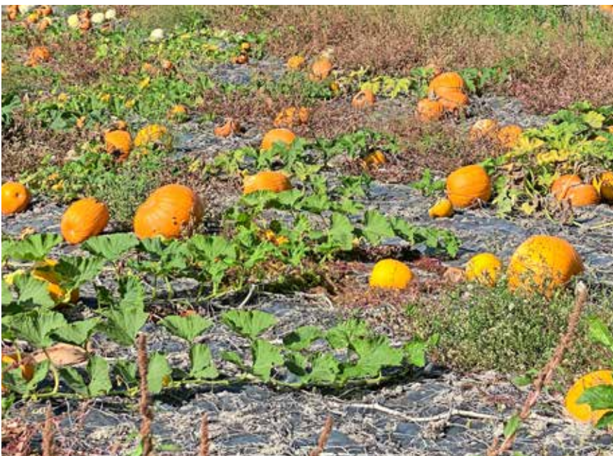
Das lange Warten auf Halloween ... La longue attente pour Halloween...