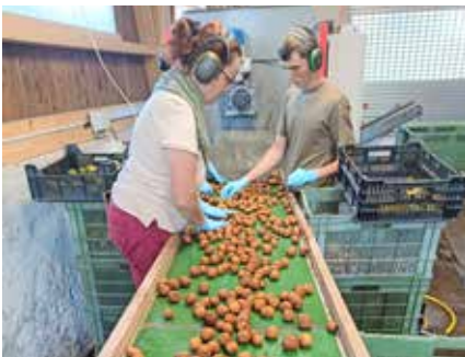
Die Nusswaschanlage läuft auf Hochtouren Installation de lavage des noix tourne à plein régime