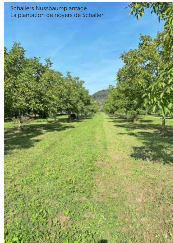
Schallers Nussbaumplantage La plantation de noyers de Schaller